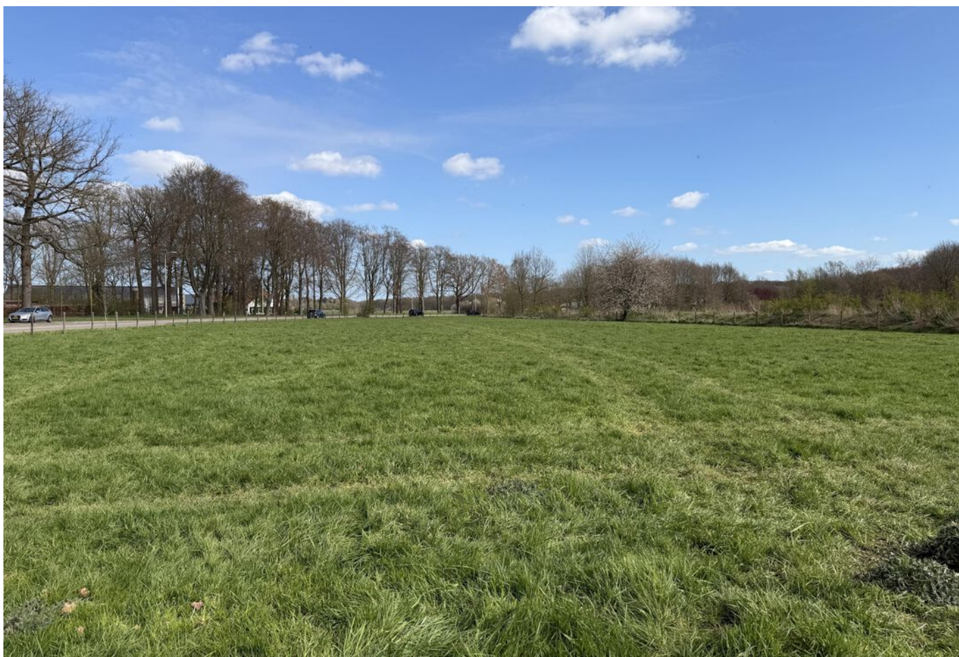
Sportlaan 0 ong, BUNNIK