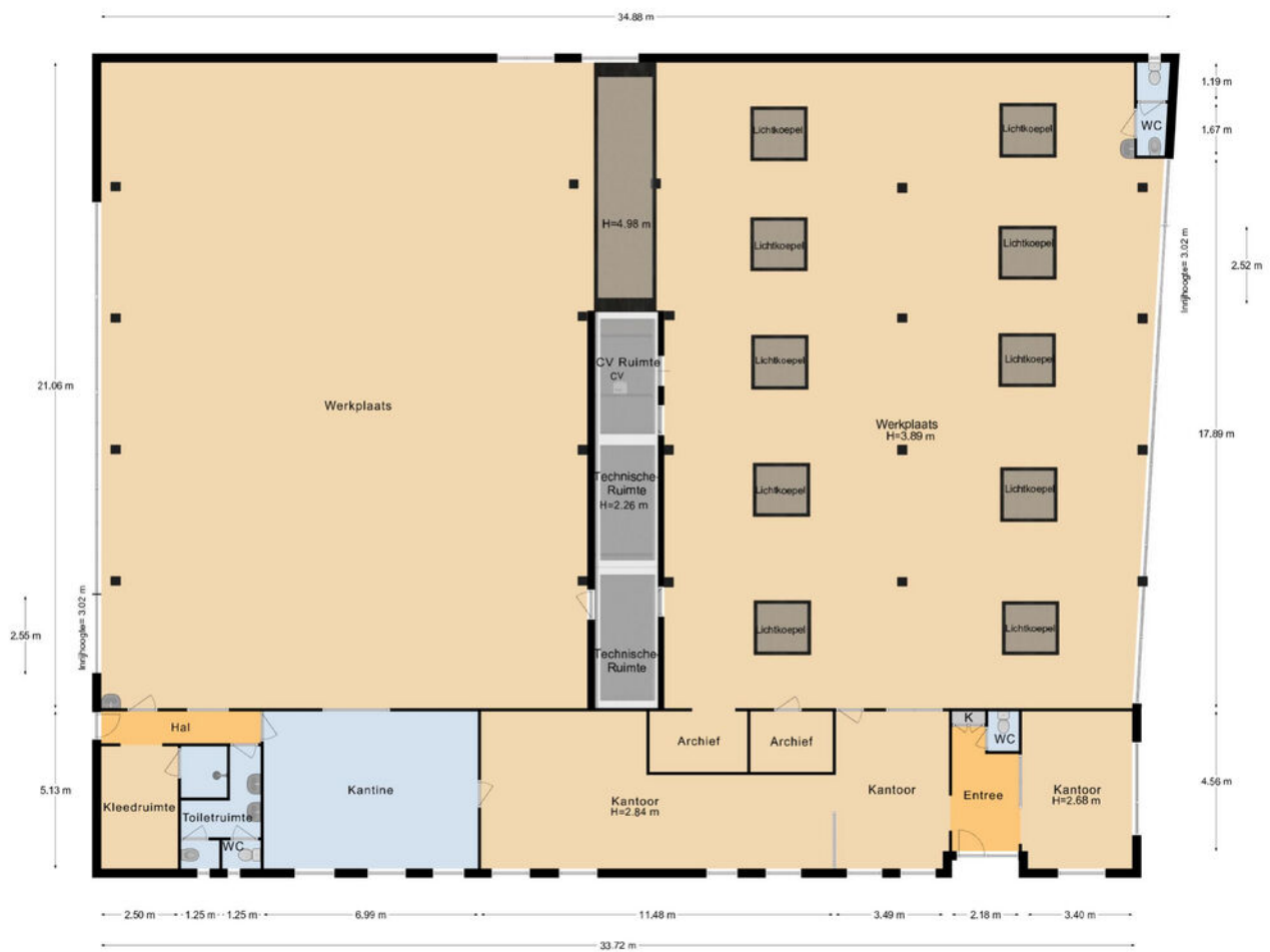
Plattegrond 881 m 2