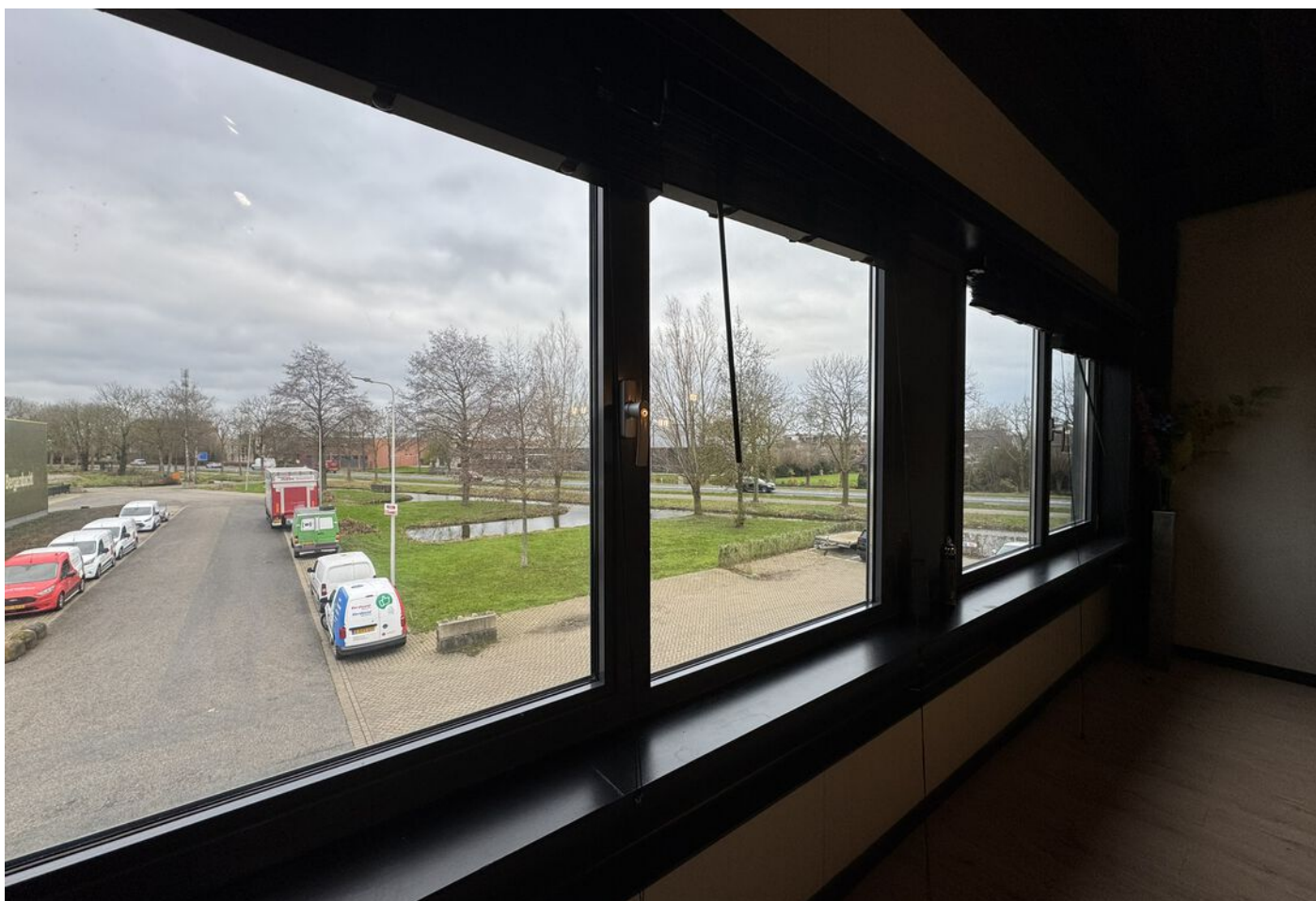
Nijverheidstraat 15 c, Bergambacht