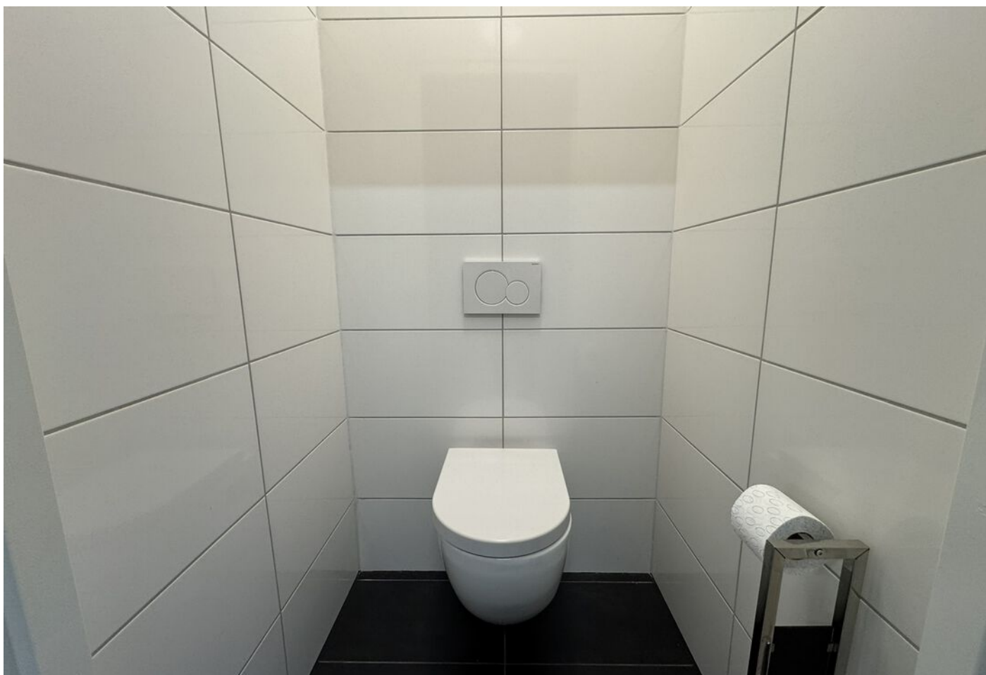
Nijverheidstraat 15 c, Bergambacht