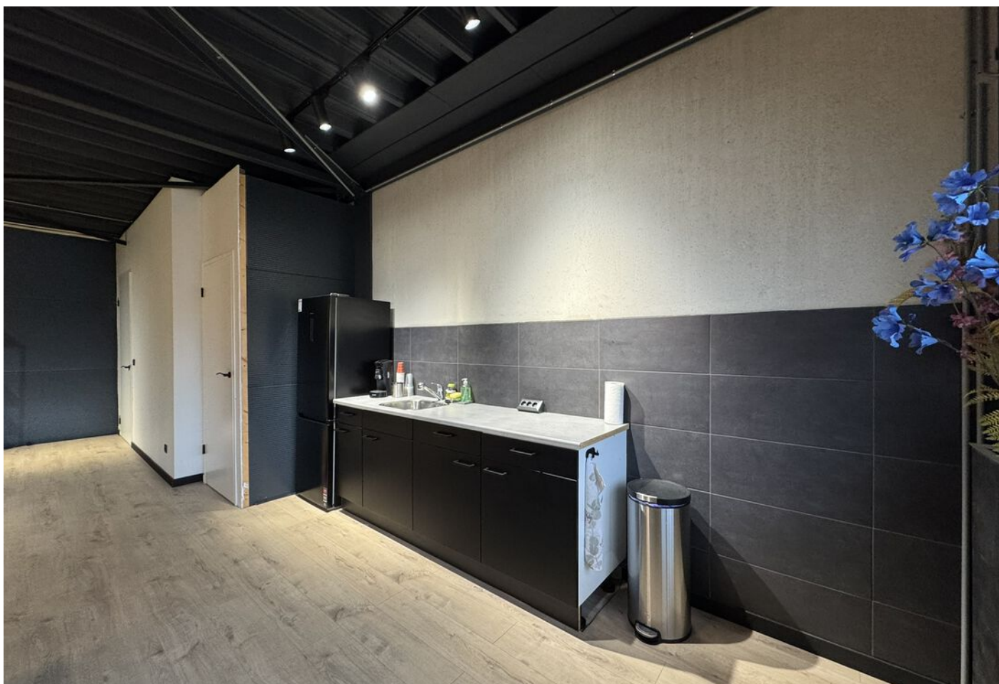
Nijverheidstraat 15 c, Bergambacht