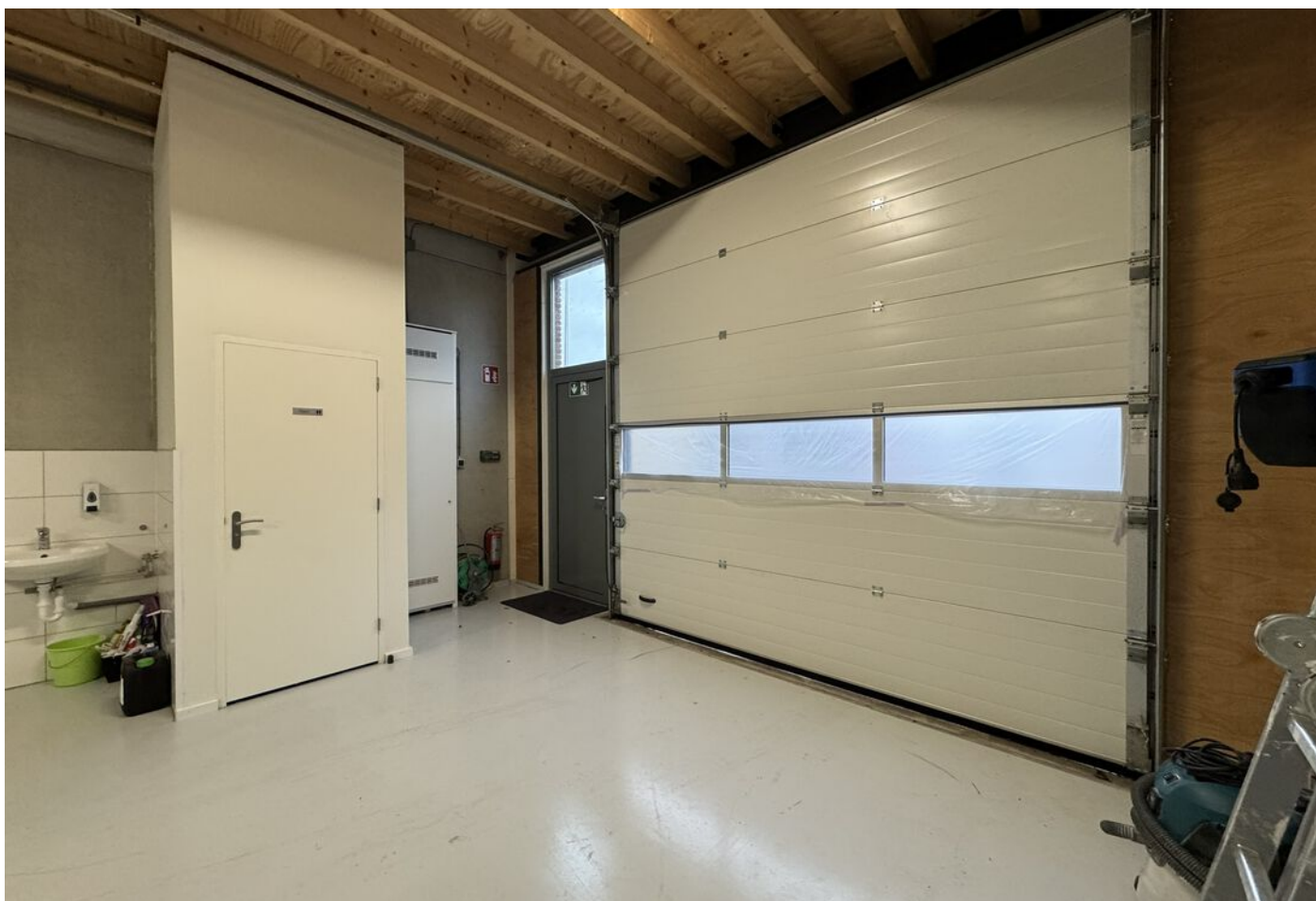
Nijverheidstraat 15 c, Bergambacht