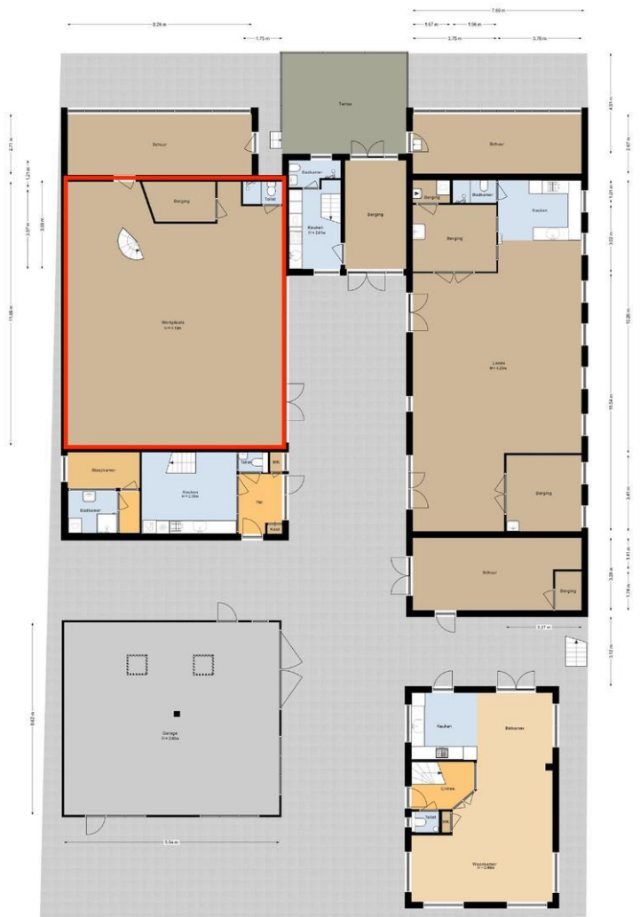
Situatie Vijfhuizerdijk 189 Vijfhuizen