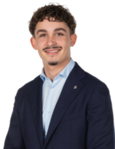
Milan> van Vliet>

Vastgoedadviseur 06 30 62 93 34 jbot@vanherk.nl