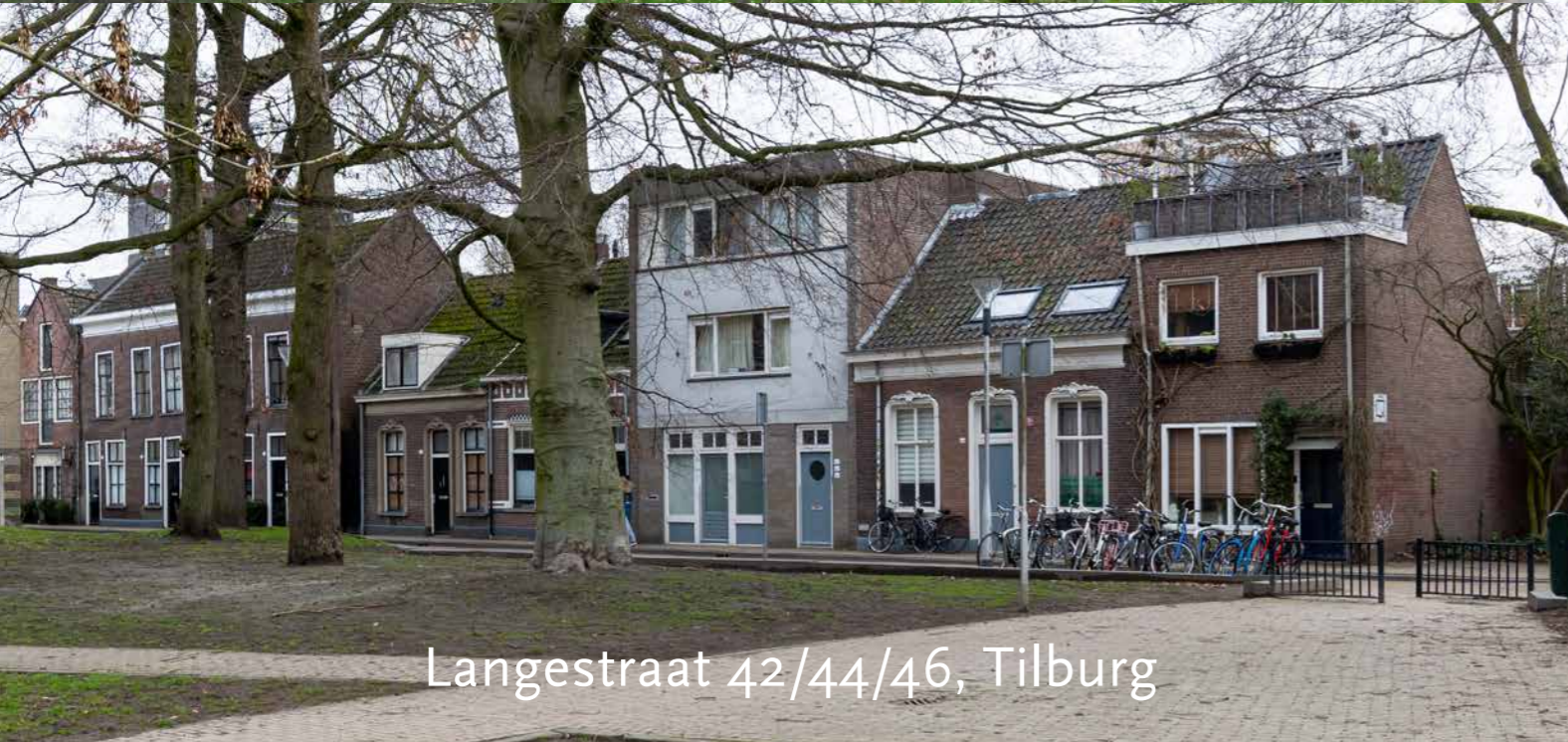
Langestraat 42/44/46, Tilburg