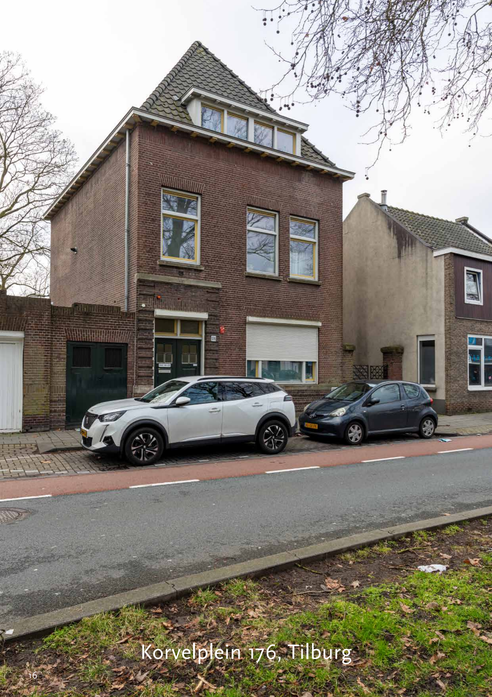
Korvelplein 176, Tilburg