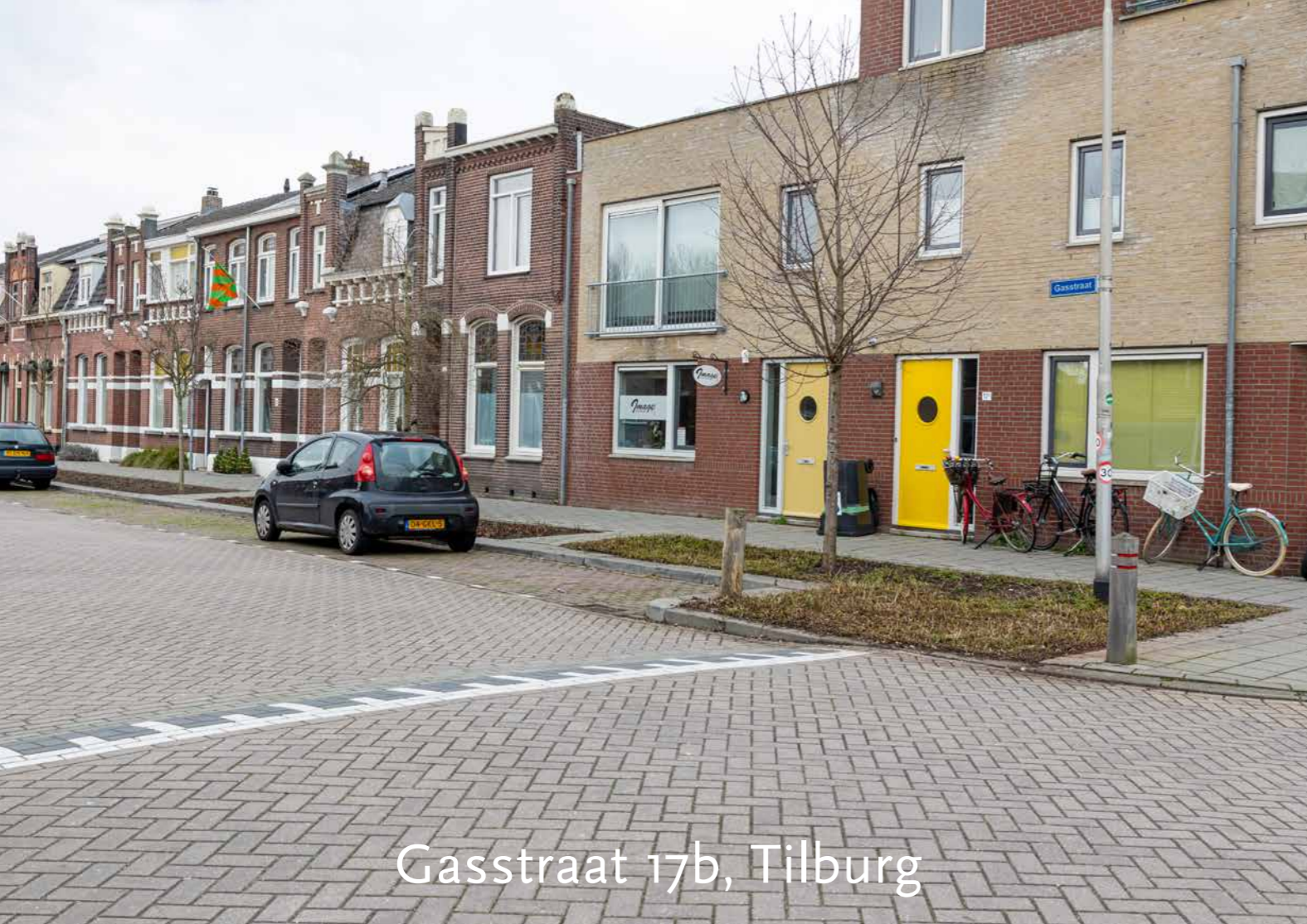
Gasstraat 17b, Tilburg