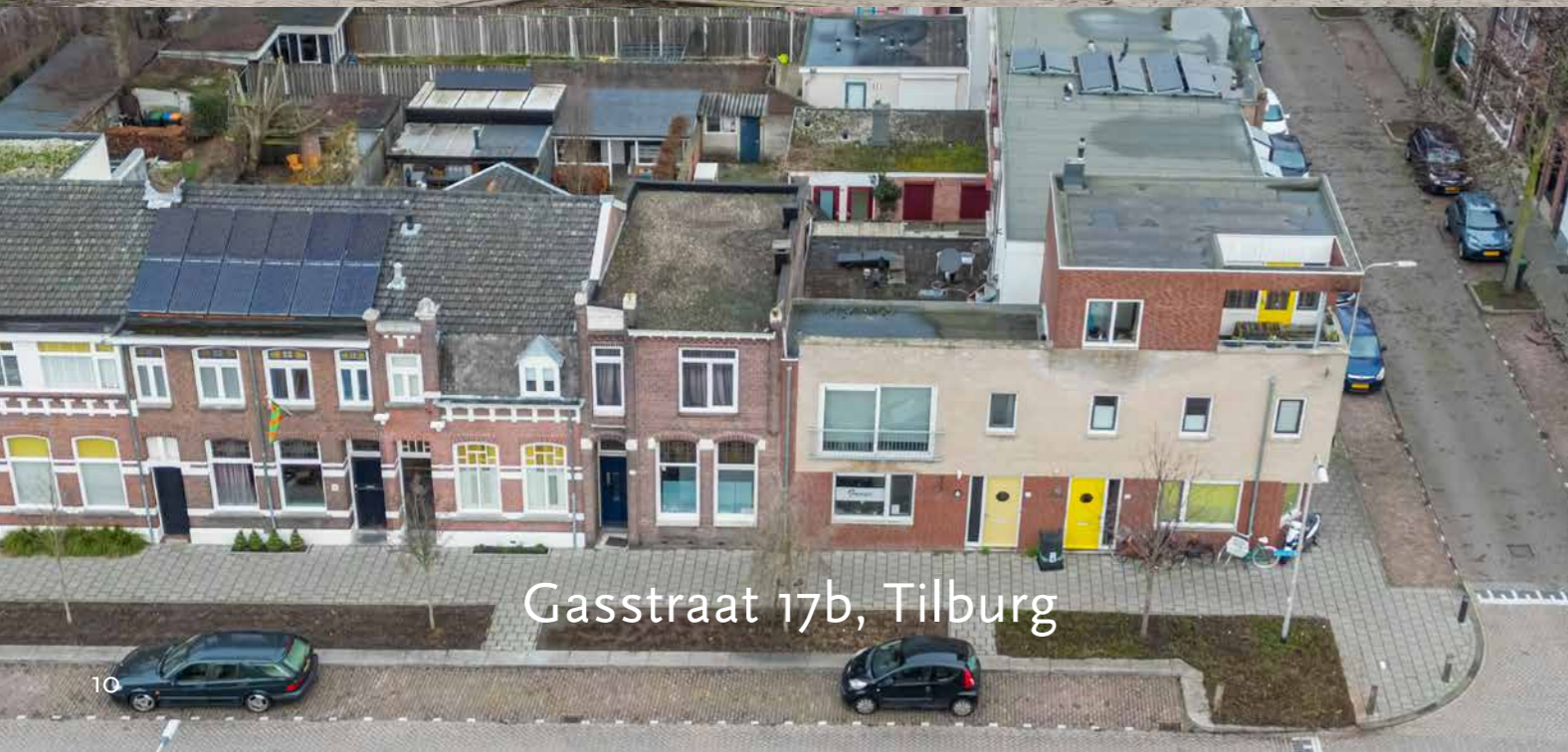
Gasstraat 17b, Tilburg