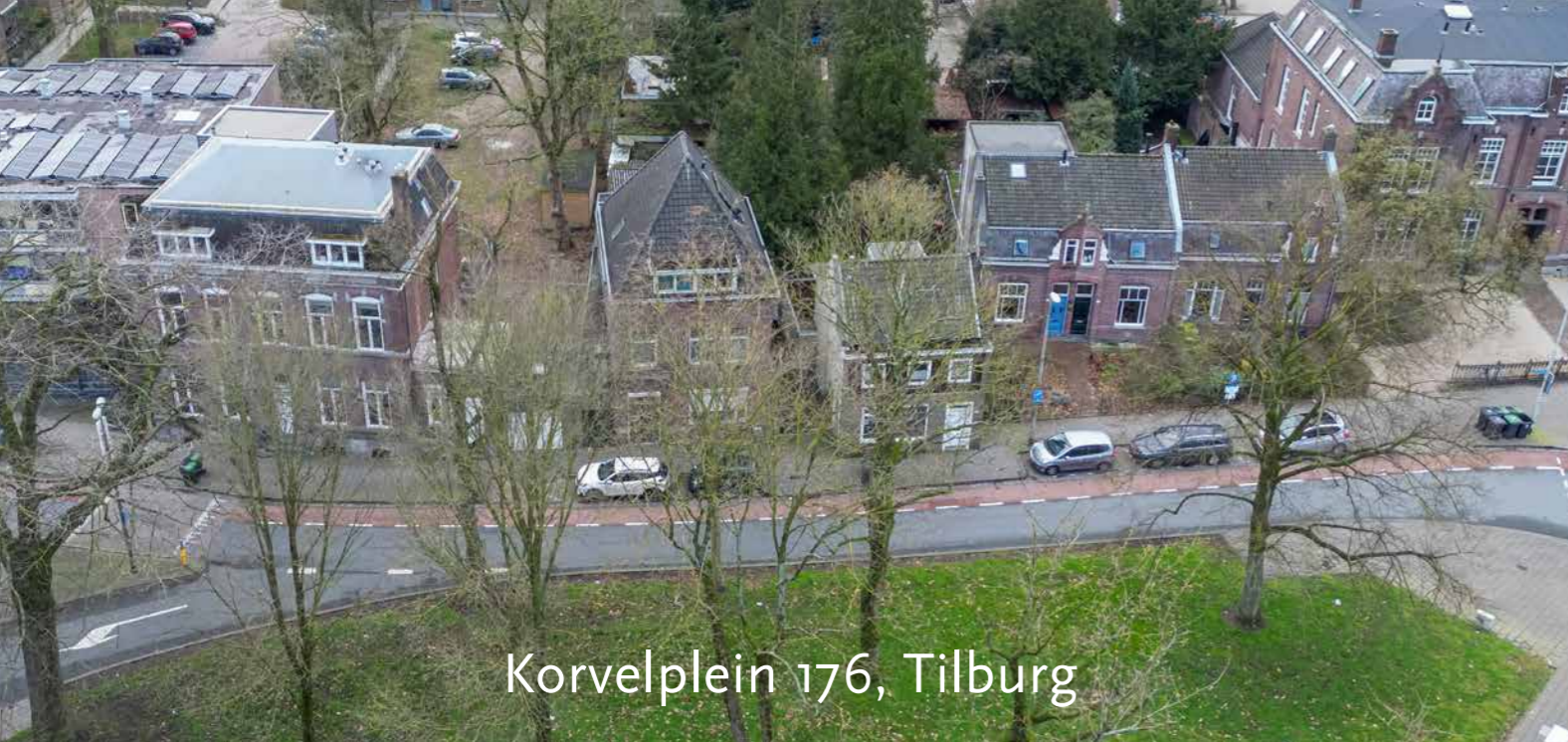
Korvelplein 176, Tilburg