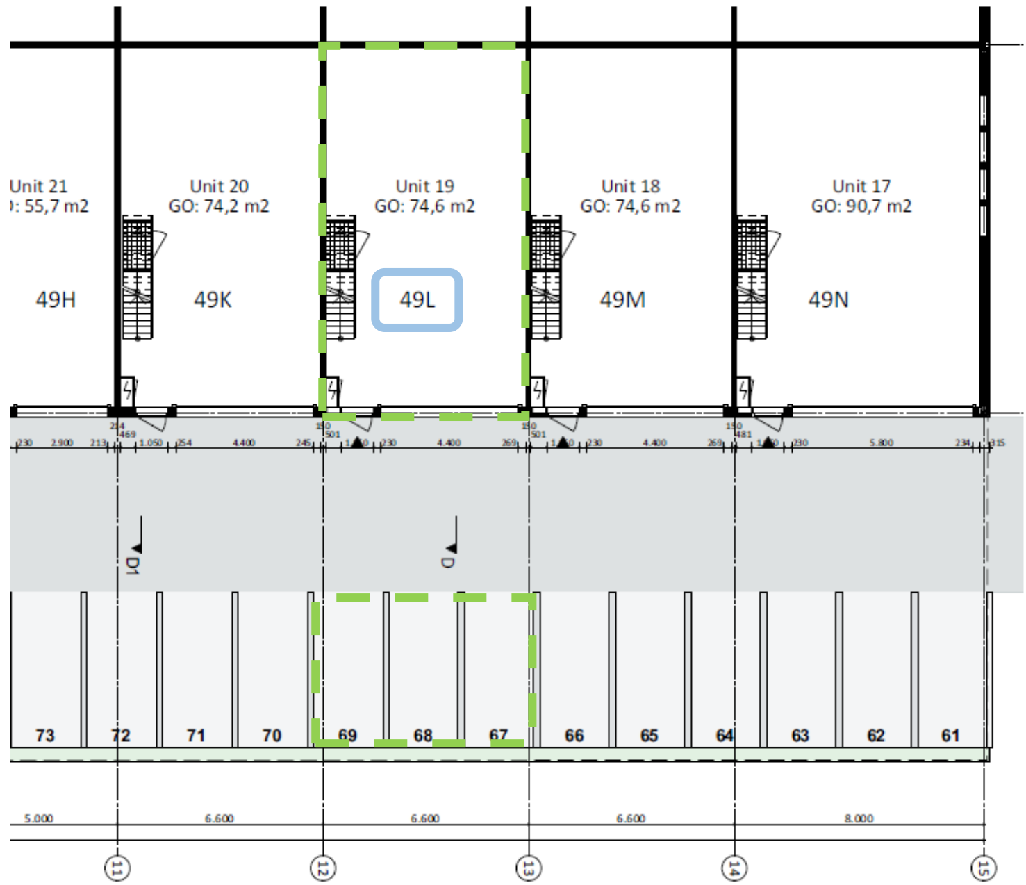
Begane grond Bedrijfsverzamelgebouw De Rode Ring, Saendelft