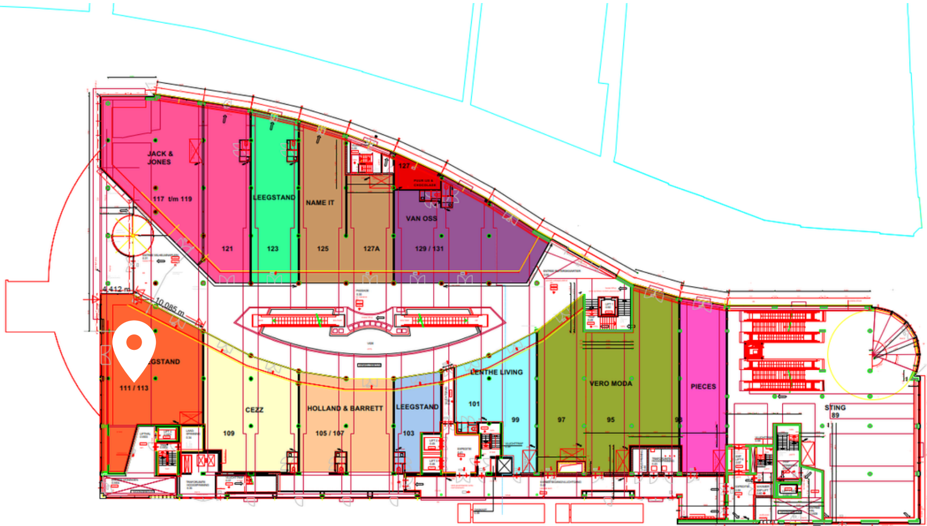
plattegrond laag 0